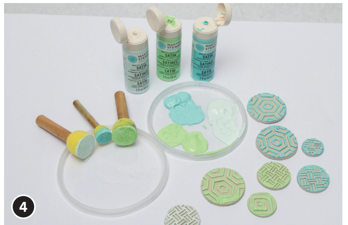
4 Met de mini sjabloneer stempels de gedroogde, ronde motieven verven.