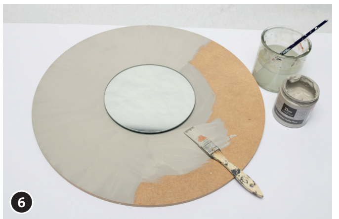
6 De houten cirkel met de chalky finish verf steengrijs verven. Dit goed laten drogen.