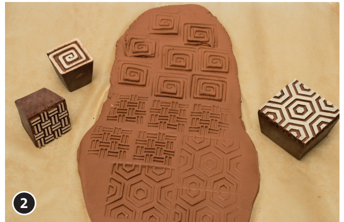
2 Met de blokstempel verschillende motieven op de platen drukken.